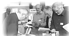
Der bliver lejlighed til at gøre en god handel.